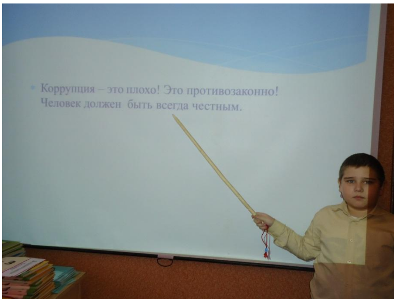
2.4. В четвертом классе проведен классный час по теме: «Без коррупции с детства»